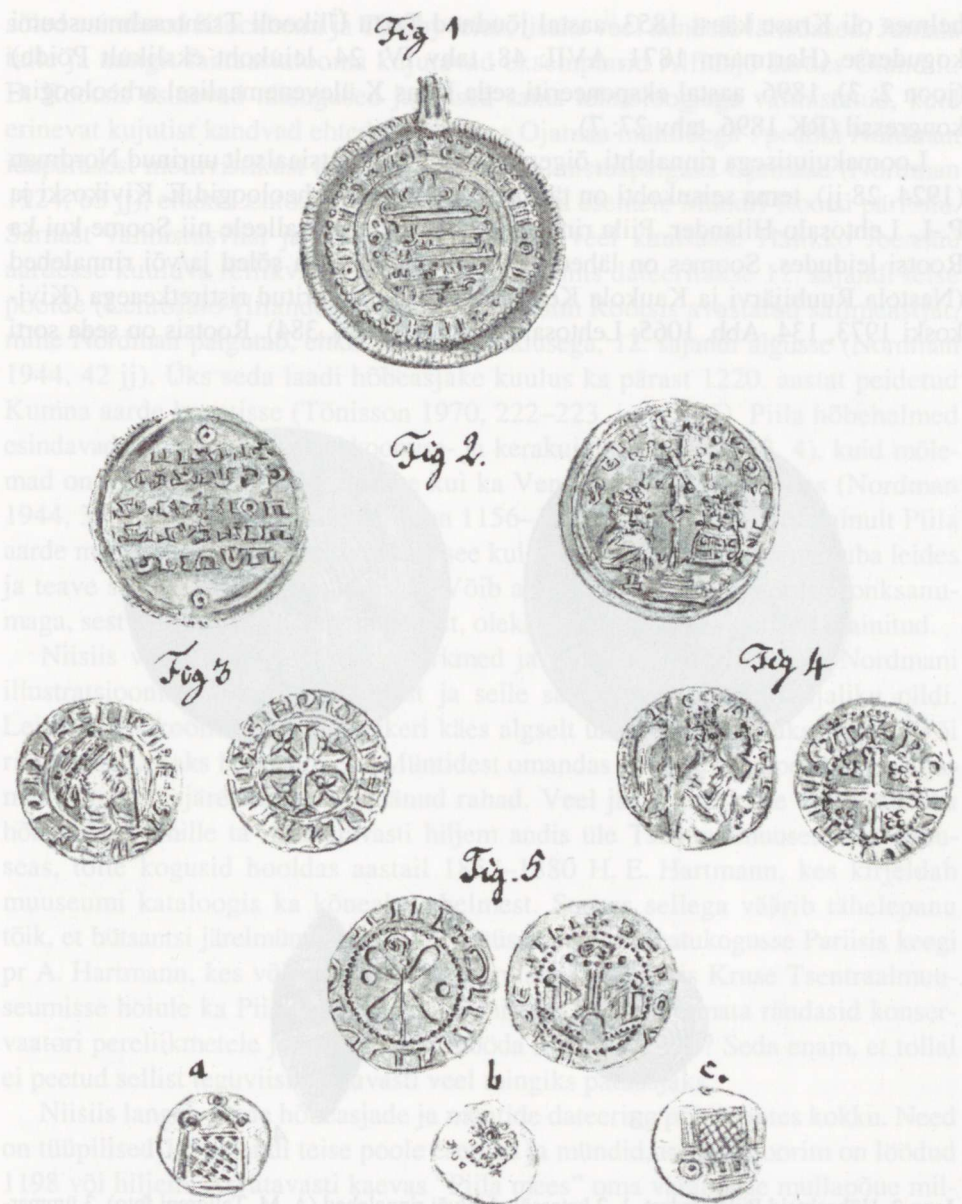
Joon 1. Piila aarde mündid E. Ph. Körberi käsikirjas.