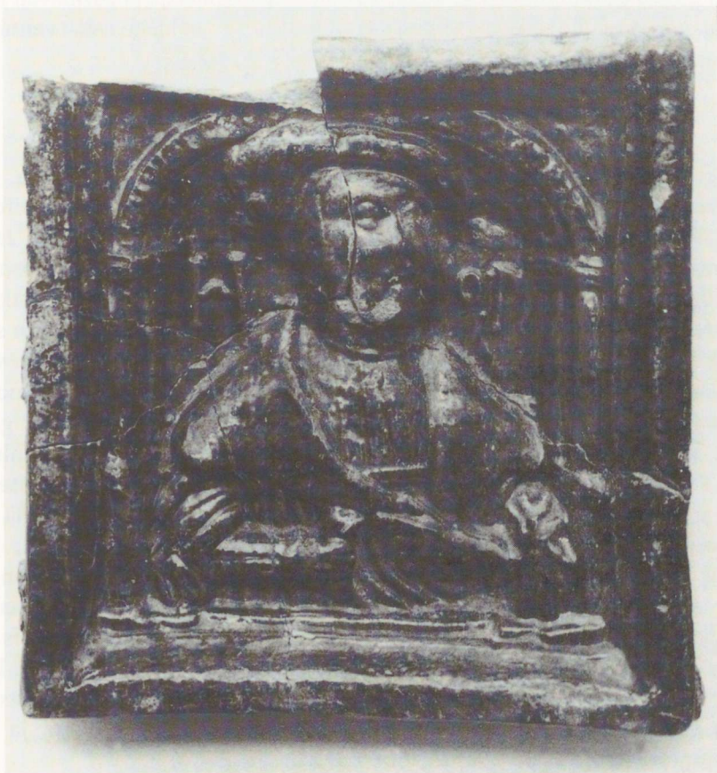
Joon. 5. Kirjarulli hoidva mehe portreekahhel Pärnust (PäM 14350/A2501: 9, 36, 92, 199). 2 : 3.

leping tsaar Ivan Julmaga. Selle sisu tekitas pealesunnitud tribuudi tõttu vastakaid hoiakuid. 8 Liivimaa poolt olid lepingu sõlmijateks ordumeister (1551–1557) Hinrich van Galeni ja Tartu piiskopi (1552–1560) Hermannus II Weseli 9 saadikud.