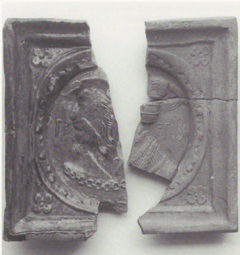
Joon. 7. Nurgarosettidega portreekahlid Pärnust: meheportree (vasakul; Päm 14350/A2501: 27, 208) ja naiseportree (paremal; Päm 14350/A2501: 165, 199). 2 : 3.

Fig. 7. Portraits on the panel-tiles with a medallion and rosettes: the portrait of a man (left) and the portrait of a lady (right), from Pärnu.