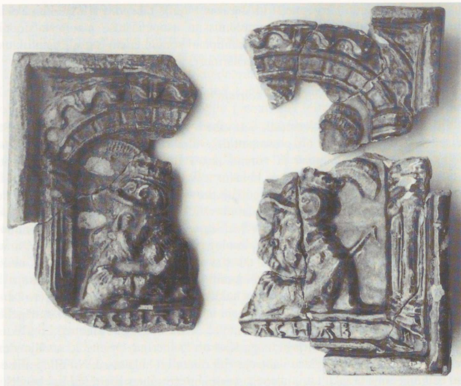
Joon. 2. Katted Pärnust leitud plaatkahlitest tekstiga Achab (PäM 14350/A2501: 29, 143, 225). 1 : 2.