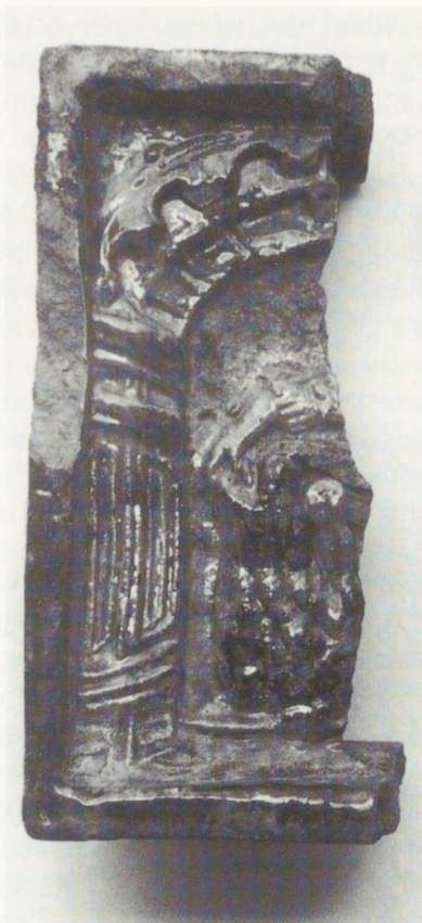
Joon. 3. Katke Pärnust leitud plaatkahlist Simsoni ja lõviga (PäM 14350/A2501: 225). 2 : 3.

Türannide-kangelaste teema ei olnud vaid protestantide monopol. Pärnus levinud kahlisarja meelsus ja isegi eeskuju ei pärine ainuüksi Penczi puugravüüridelt. Arvestades selle sarja kahlite kujunduse suhtelist primitiivsust, on nad valmistatud ilmselt kohalikku päritolu matriitsidega. Tundub, et populaarseid