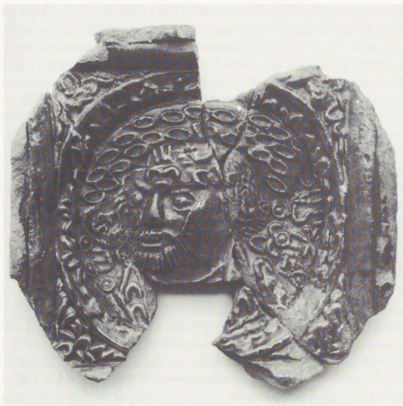
Joon. 4. Portreekahhel Pärnust (PäM 14350/A2501: 55, 199). 2 : 3.