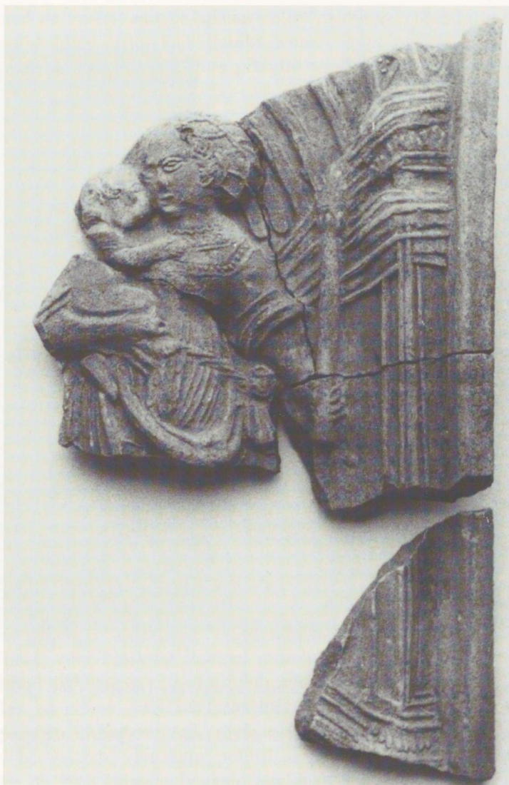
Joon. 6. Jumalaemaga nišškahhel Pärnust (PäM 14350/A2501: 155). 2 : 3.