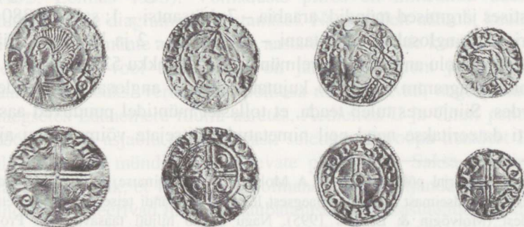
Joon. 1. Anglosaksi münte Edise leiust.

1903.–1904. aastal annetas Edise paruness Rosen Eestimaa Kirjanduse Ühingu Muuseumile (nimetatud ka Provintσιαalmuuseumiks) viikingiaegse mündiaarde (Beitr. VI, 456). Aare leiti augustis 1903 ja see asus Virumaal Jõhvi kihelkonnas, umbes poolel teel Edise ja Kukruse mõisa vahel suure kivi juures vahetult maapinna lähedal. Paraku läks peitleid nagu teisedki Provintσιαalmuuseumi viikingiaegsed mündiaarded Teise maailmasõja aastail kaduma (Molvõgin 1994a, 15). 1979. aastal õnnestus Eesti Ajaloomuuseumil erakätest omandada mitmeid 11. sajandi münte, mille hulgas oli ka mõni Edise aardesse kuulunud denaar (nimistus nr. 18, 58, 88, 100; joon. 1).