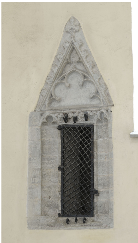
Joon 8. Kristuse haud ehk Ryssenberchi monstrantsi jaoks ehitatud nišš kooriümbriskäigu lõuna-seinas.

monstrantsile: Kristuse haud tehti 1476. aastal, monstrants kullati 1477. aastaks. 166 Monstrants oli mõeldud pühitsetud hostia ehk Kristuse ihu visuaalseks eksponeerimiseks missal ja ringikandmiseks protsessioonidel. Antud kontekstis on huvitav märkida, et kõrge tornikujuline korpus muutus domineerivaks alles 15. sajandil. 167 Küllap oli ka Risti kiriku idaseina lõunapoolsel nišil Kristuse haa tähendus. Kus oleks see veel aktuaalsem kui Püha Risti kirikus?