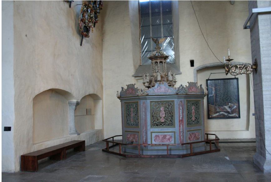
Joon 5. Kornede perekonnakabel pikihoone põhjalöövi läänevõlvikus.

väljamaksed altari peetud hingemissade eest. 113 Pole kahtlust, et Kornede perekonnakabeli kaitsepühak oli Neitsi Maarja.