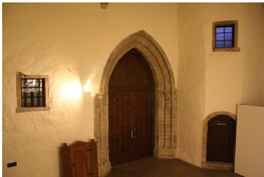
Joon 2. Torni põhjaportaal selle ees asunud kabeli konsooli ja uusaegse trepitorniga.

Ehituslikult on torni põhjaportaal trepitornist vanem, kuna viimase ehitusega on osaliselt kaetud portaali läänepoolse palendi väliskülg. Seega võib öelda, et trepitorni ehituse ja torni põhjaportaali valmimise vahele jääb mõningane ajavahe-mik. Trepitorni valgustavad suured nelinurksed raidraamistuses trellitatud aknad, mis kõik on ehitusaegsed. Kui enamik neist asub trepitorni lääneküljel, siis üks asub ka idaküljel ja Kangropooli ning Lumiste kontseptsiooni kohaselt pidanuks avanema kabelisse. Trepikäigu valgustamises teise ruumi kaudu pole keskaegset