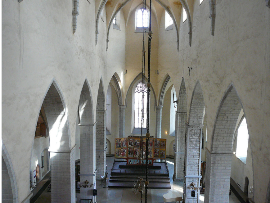
Joon 7. Vaade kooriruumi oreilirõdult.

dustades polügonaaelses vormis lõpmiku. Ruum muutus avaraks ja valgusküllaseks. Uue kooriruumi kesksed võlvikud ümbritseti paari meetri kõrguse seinaga või võrega. 134 Seal paiknes Püha Nikolause peaaltar.