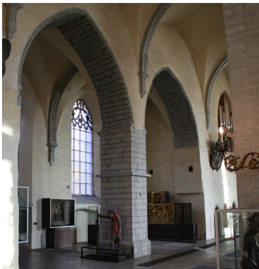
Joon 3. Barbara kabel (hilisem Väike kabel) pikihoone põhjaküljel.

Niguliste kiriku Väike kabel on dateeritud üldsõnaliselt 14. sajandi teise poolega, 43 kuid on toodud ka täpsem ajaline määratlus: peale aastat 1385. Viimane dateering toetub oletusele, et Väikest kabelit saab seostada allikates korduvalt mainitud Niguliste kirikus asunud Kornu perekonna kabeliga. 44 Paraku ei ole sellel oletusel mingit allikalist tagapõhja. Sidudes Väikese kabeli Barbara kabeliga saab allikalistele teadetele toetudes väita, et kabel valmis 1391. aastaks, mil on nimetatud Lucca risti altarit.