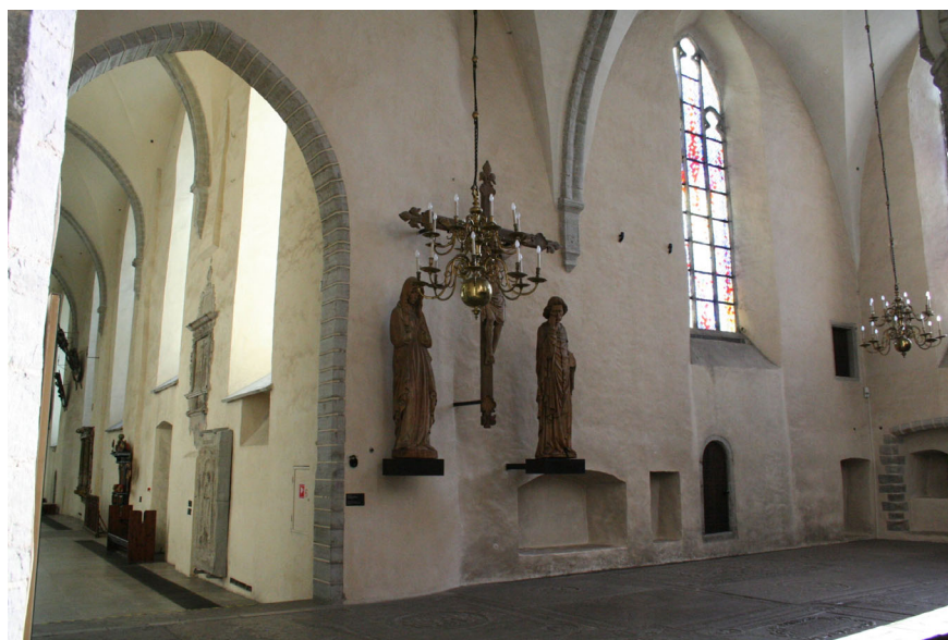
Joon 6. Matteuse kabeli idasein.

Uuenenud Matteuse kabelis jätkus piisavalt ruumi kõigile kolmele altarile, mille võimalikke asukohti markeerivad kappide nišid idaseinas 128 (joon 6). Need pididki järjestikku paiknema, sest 1500. aastast on eestseisjate raamatus Hans Rotgersi käega juurde kirjutatud märkus ühe eseme kohta, mis kuulus Matteuse kabeli keskmisele altarile. 129 Kui lihunike altar jäi “kellatorni alla”, pidi Matteuse altar liikuma kabeli uude ossa. Eeldades, et rae altar oli paremini varustatud kui lihunike või Antoniuse vennaskonna oma, oleks kõige esinduslikumaks uueks asupaigaks kabeli kagunurk, kus paikneb piscina ja kus oleks võimalik asetada altar kapi kõrvale idaseina vastu. Selle kohale jääb ka jutlustool. Kuid välistada ei saa