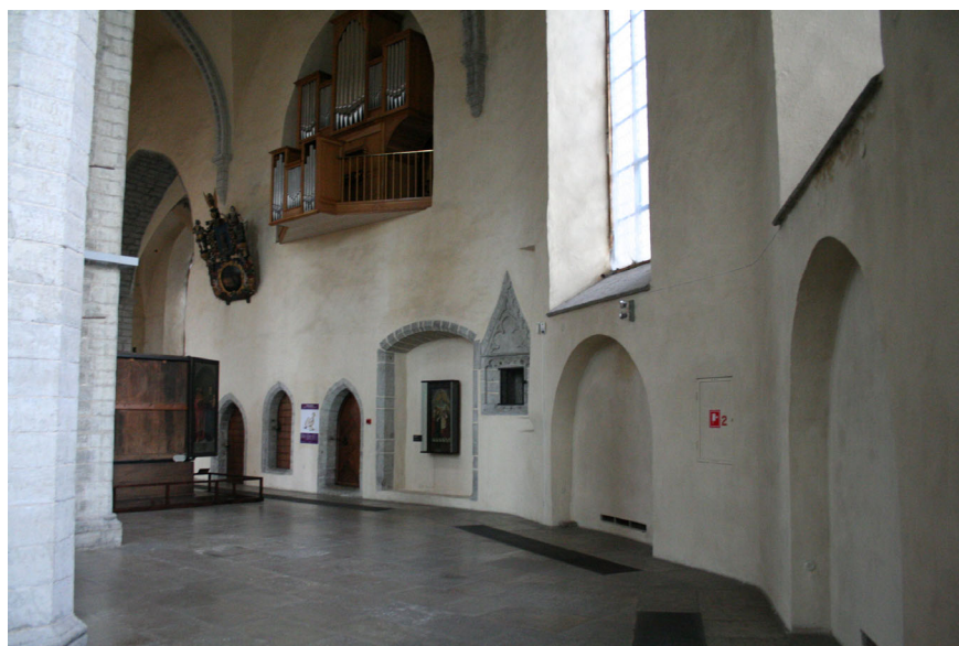
Joon 9. Kooriümbriskäigu põhjasein. Esiplaanil seppade altari asukoht (akna all) ja selle juurde kuulunud väikese monstrantsi nišš.

Veel on teada, et käärkambri juures asus Suurgildi Püha Blasiuse, Viktori ja Jüri altar. 175 Kuna altar peab olema itta suunatud, ei olegi seal väga palju paigutusvõimalusi. Lüübeki Maarjakirikus oli üks altar asetatud küljega vastu koorivõre põhjaseina, Lüübeki toomkirikus seevastu nihutatud triumfikaare joonel paikneva põhjapoolse piilari vastu. 176 Niguliste kirikus tuleks kõne alla pigem koorivõre põhjasein. Kahe piilari vahele mahuksid nii altar, selle ees asetsenud hauakivi kui ka võimalikud naistepingid. 177 Altaril seisid nimipühakute puuskulptuurid. Kuna tegemist oli jõuka gildi altariga, oli see ka liturgiliste esemetega tavapärasest luksuslikumalt varustatud. 178 Siinkohal meenub suur neljakandiline avaus käärkambri seinas, mis ehitati koos põhjaseina nišiga. See sobib vääriliseks asjade hoiustamiskohaks Suurgildile suurepäraselt.